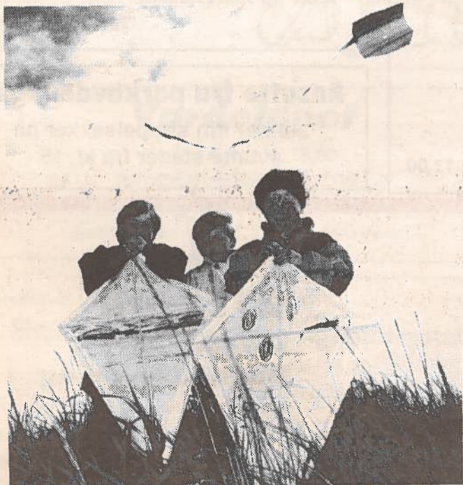
Legg søndagsturen til Storhaugmarka