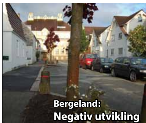
Bergeland: Negativ utvikling