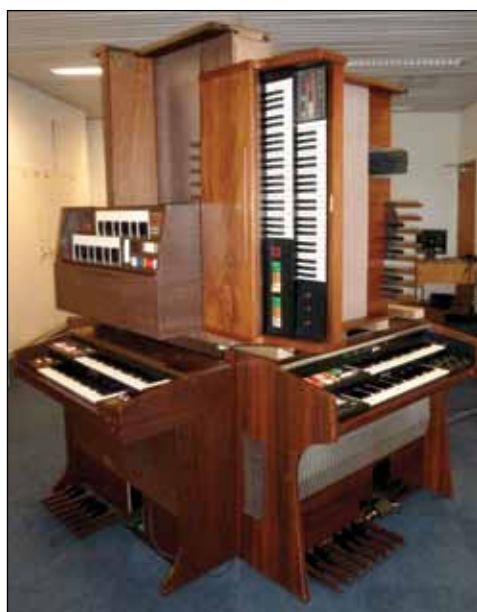
Resirkulerte orgler - en installasjon av Nils Henrik Asheim.