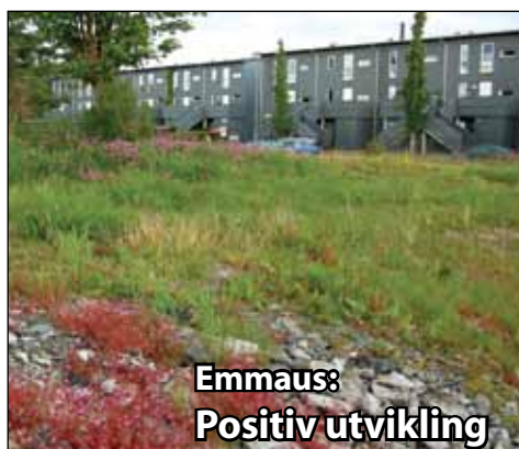
Emmaus: Positiv utvikling