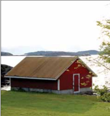
Skal kommunen kjøpe naustet?

vil være med å påvirke planen til nytt møte før forslagsfristen går ut. Vi har tatt på alvor forslagene fra det åpne møtet vi hadde i mai. De som oppgav adresse til oss vil få tilsendt planen. Den legges også ut på vår hjemmeside og så kan vi godt legge noen eksemplarer på Midjord bydelshus.