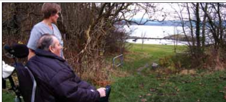
Utålmodig venting på at stien skal bli tilgjengelig for alle.