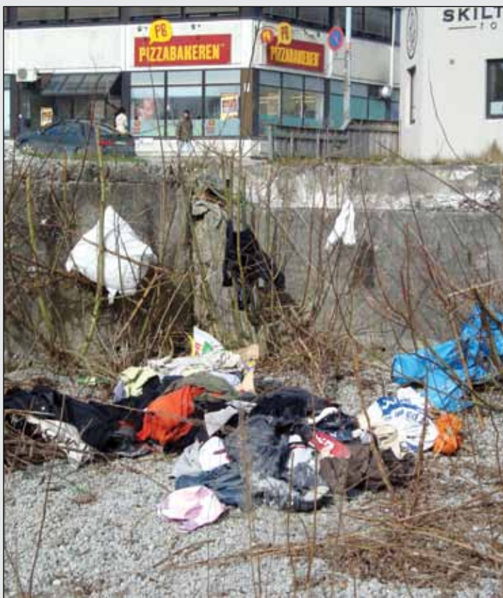
Fra området ved skatehallen før det ble ryddet.

Beboere i Lervig har lenge ergret seg over tilstandene og har kontaktet kommunen gjentatte ganger. Tre frivillige pensjonerte damer tok initiativ til å plukke søppel som fløt i området. Men mengden søppel og manglende opprydding fra grunneier i årevis tilsier at her kommer selv frivilligheten til kort.