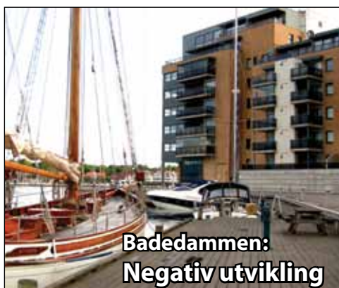
Badedammen: Negativ utvikling