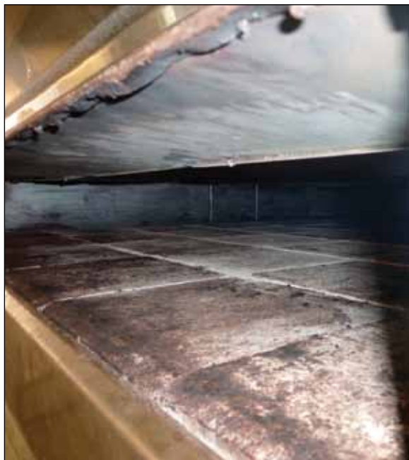
Steinbakt brød i ovnen bygget på stedet gir bakverk av beste kvalitet.