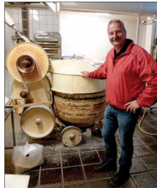
Eliemaskinen fra 1911 er fortsatt i bruk i produksjonen hos Fredriks.