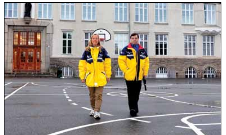
Natteravnene tar turen innom bydelens skoler. Her på St. Svithun Ungdomsskole.