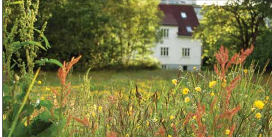
Hva skal huset brukes til?