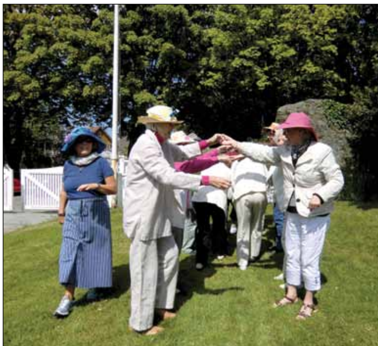
Polynese for å holde varmen - og for å ha det moro!