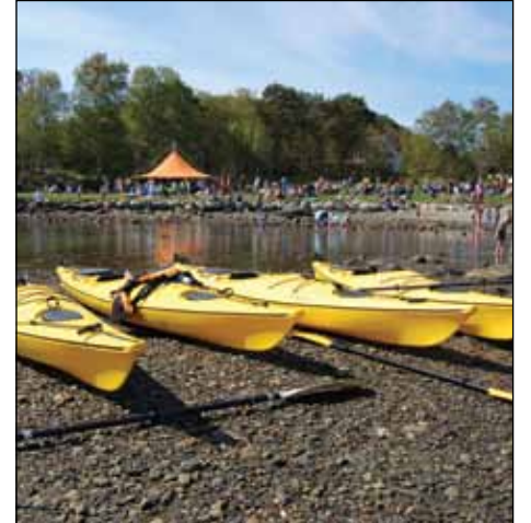
Blir det servicebygg ved stranda?