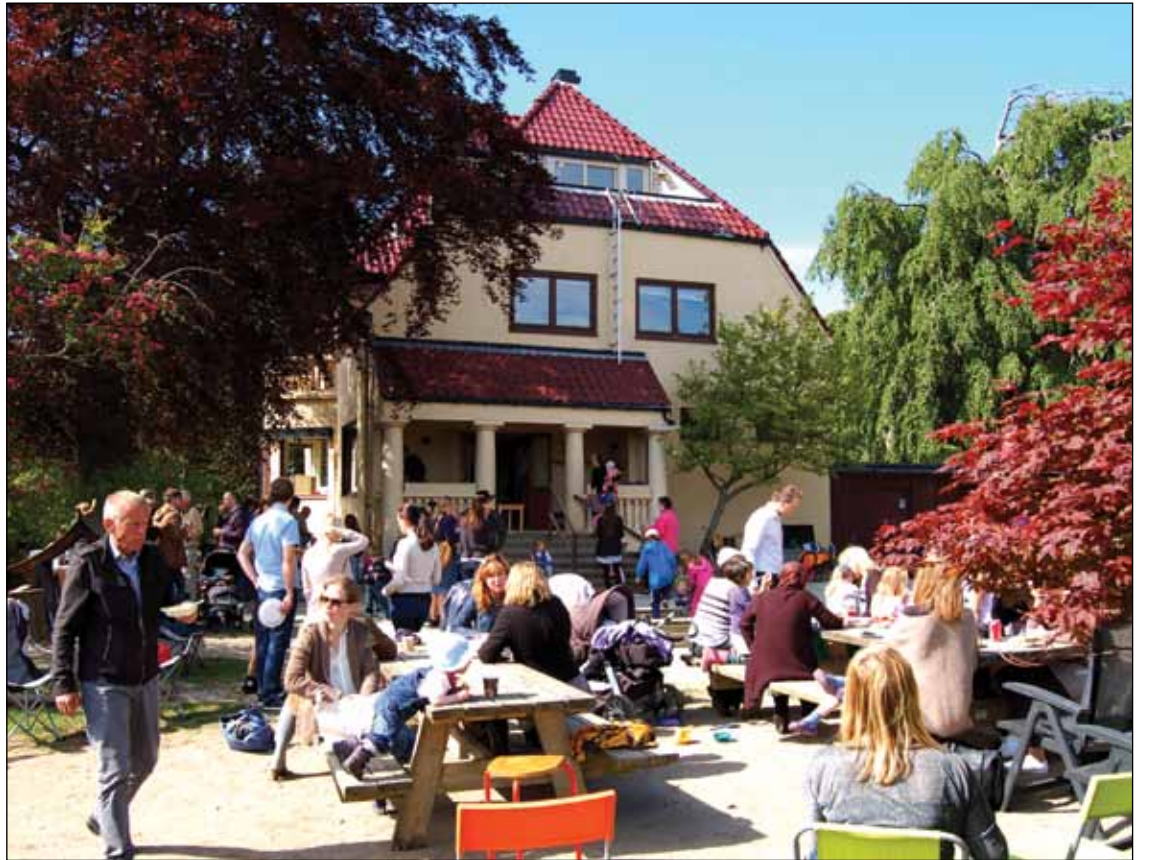
Kløvereng barnehage er kommunal med 41 barn og 12 ansatte.