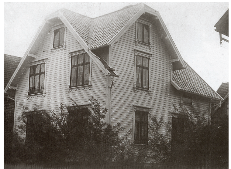
Hasivs barndomshjem og hus i Haukeligata 58. Bildet er fra 1920-årene, med sprinkelgjerde og piletrær.

Hasiv har alltid hatt fotoapparatet med seg, og dermed har han gjennom årene bygget opp en betydelig fotosamling av stor lokalhistorisk verdi.