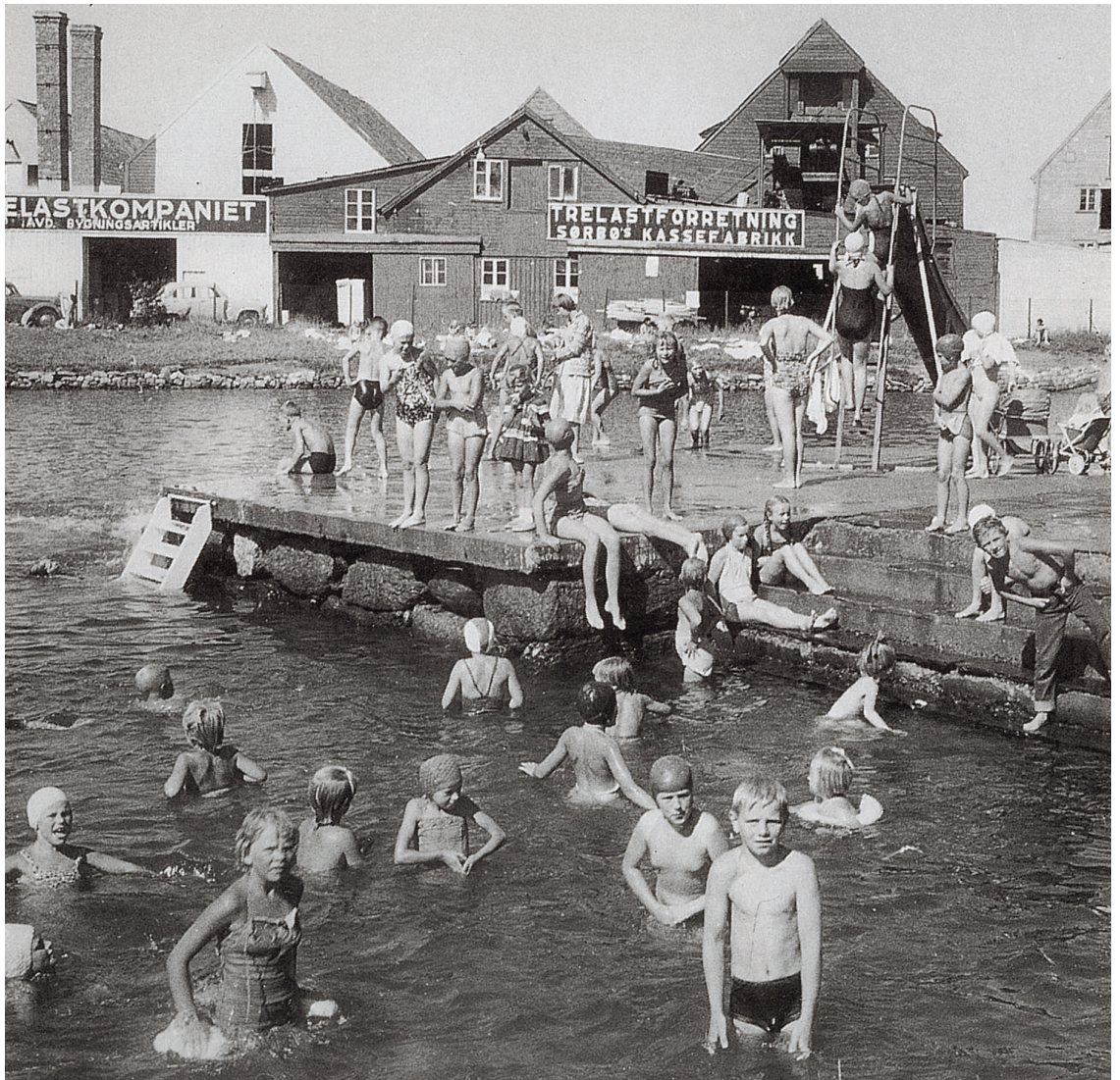
Hasiv reddet Badedammen, en vannperle og en oase midt i industriområdet. Tusener av barn har gjennom årene lært å svømme her. Mange lærte det av Hasiv.

-I 1979 ble han tildelt Rogalandsidrettens ærespris.