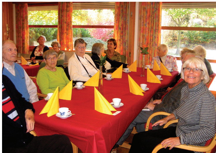
Fra åpningen av Bydelskaféen