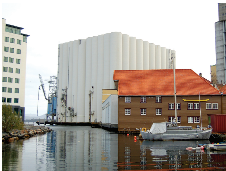
På venstre side av Svankevigå ser vi Aker og på høyre side det som før var Stavanger havnesilo. Den lysebrune trebygningen er Nordkronens tidligere administrasjonsbygg hvor Ut i naturen har flyttet inn.

–Uten tvil kajakken. Blant våre kunder er det ca 95 % som ender opp med å velge kajak fordi den er stødigere, raskere og kjekkere.