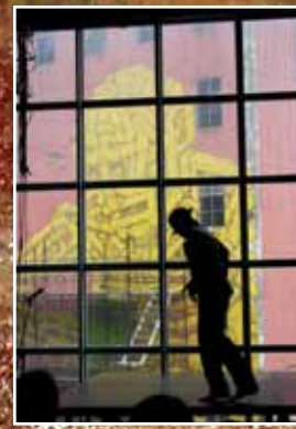
Alain Moralez fra SalsaNor med danse-show.