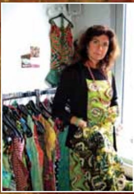
Sommermarked med kjoler laget av kvinner i Uganda.