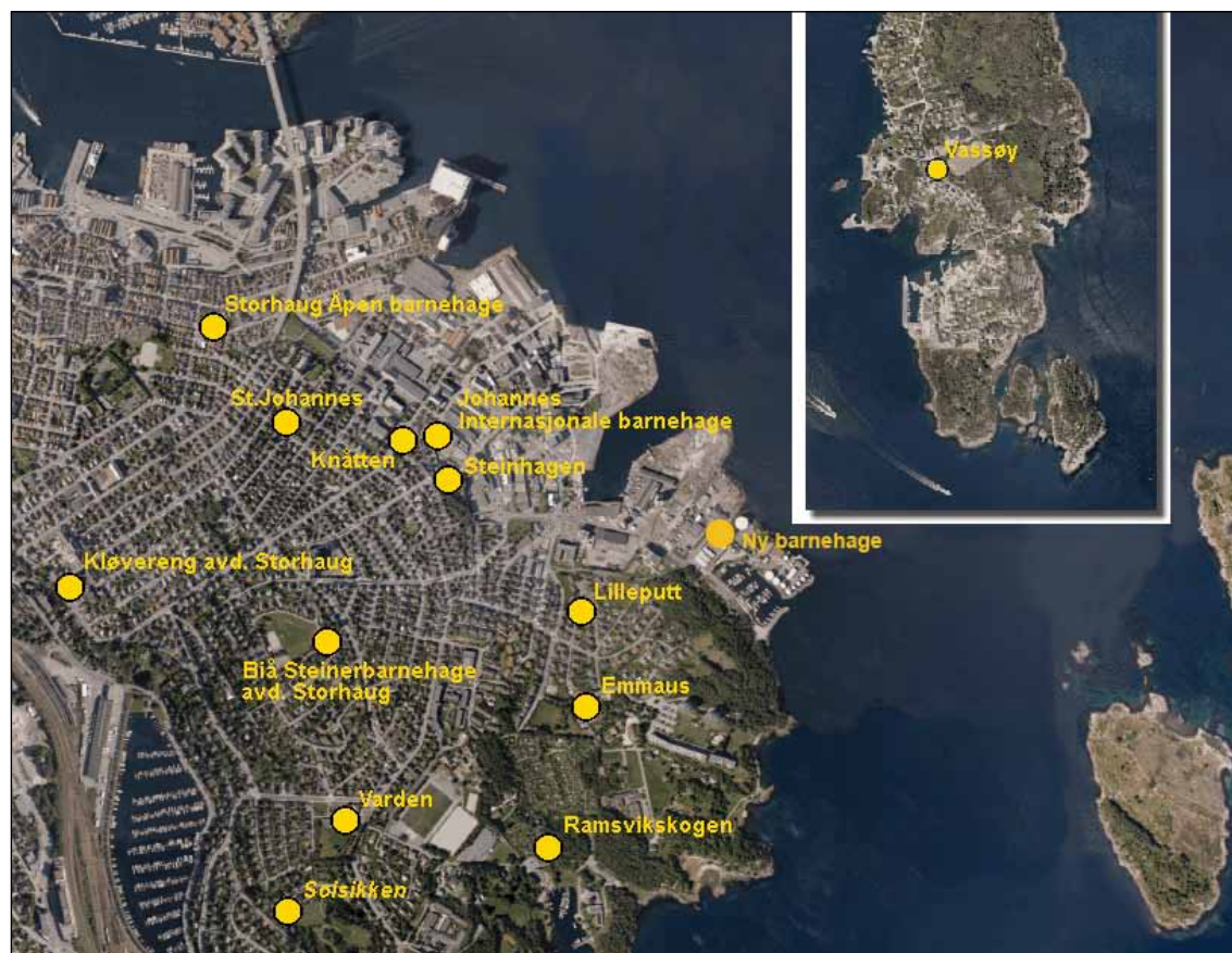
Kartet viser eksisterende og planlagte barnehager i bydelen. Det er få barnehager nær sentrum i nordvest.