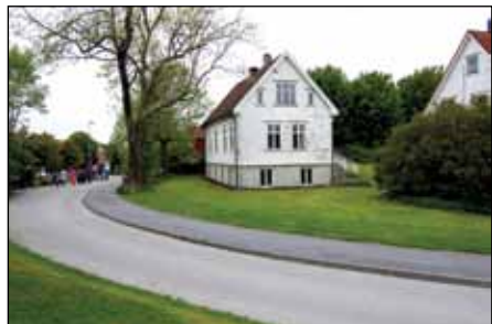
Emmaus barnehage skal etter planen romme ca 300 barn i 2013. Det tidligere bedehuset Litle Bethania skal bevares innenfor barnehagetomten. Gamle barnehjemshus skal rives.