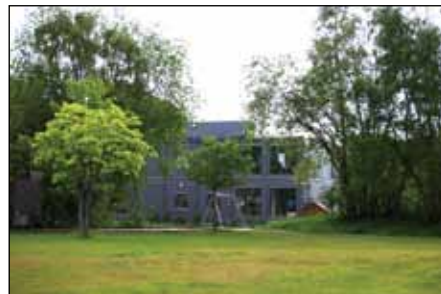
Den midlertidige barnehagedriften i modulbyggene ved Rosendal & Ramsvik kolonihage forlenges til 2016.