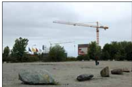
Ved Breivik båthavn kommer ny barnehage i 2012 med ca 96 plasser.

Bystyret har vedtatt Stavangers barnehagebruksplan fram til 2016. I følge planen vil det oppnås full barnehagedekning i Storhaug bydel i 2013. Og den siste levekårsundersøkelsen legges til grunn for vurderingene.