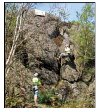
Til topps på Talaren