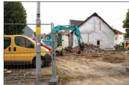
Tidligere St Johannes barnehage i Nymansveien er revet. Her skal bygges nytt bygg og gammelt hus skal rehabiliteres. Innflytting planlegges sommer 2012.

Kommunen skal dekke barnehagebehovet for barn som fyller 1 år før 1. september det året de begynner i barnehage. Ved å innføre denne regelen reduseres kapasitetsbehovet for ett-årskullene med 1/3 i forhold til tidligere planer.