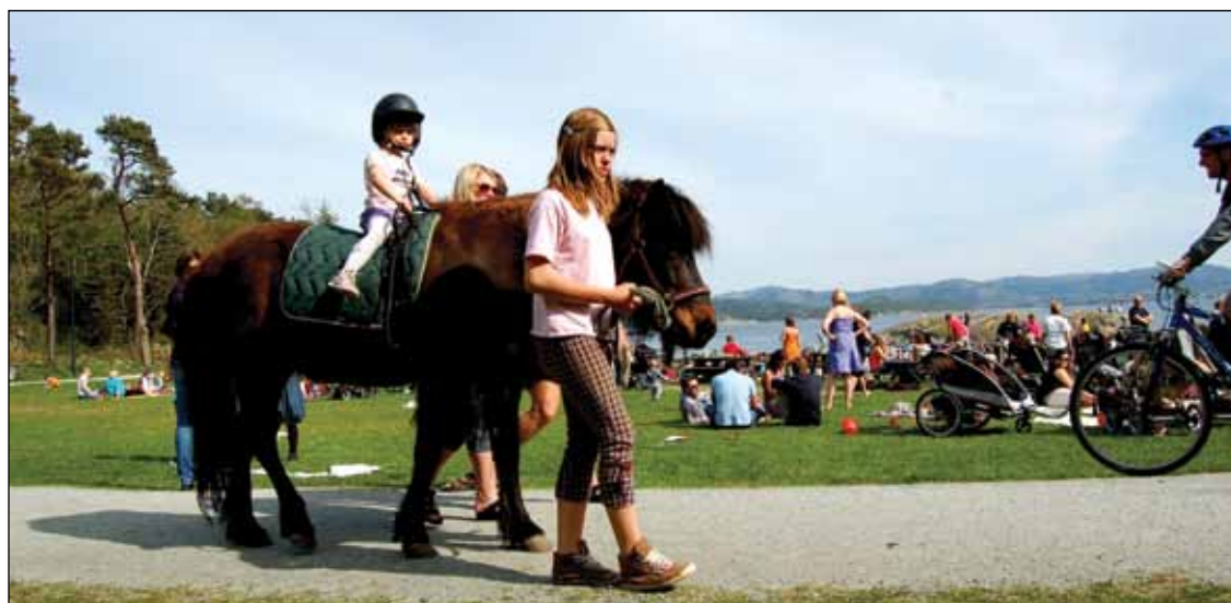
Storhaug Rideklubb gledet mange barn denne dagen!

Tekst og foto: Valerie Glaser og Miriam Bulla