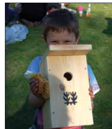
Fuglekasse og vaffel