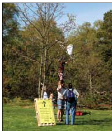
På jakt etter dragen