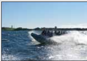
Bildet er fra Fjord Events.