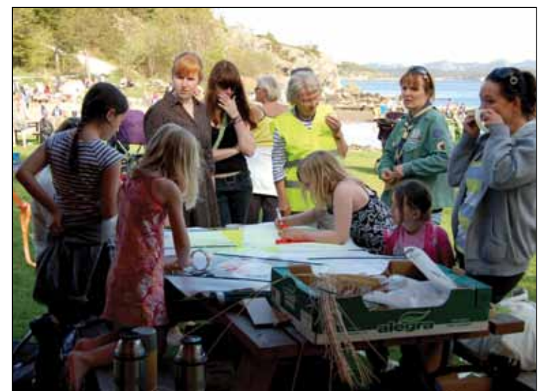
Å lage egen drage er utrolig gøy!