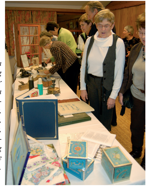
Juleskrin fra Bjelland og iddiser, glansbilder i telefonkatalog fra 1932, rasjoneringskort, familiebilder, gamle servietter, kjøkkenredskaper, pynteting, skolebøker, pennal og blekkhus, broderte duker m.m.