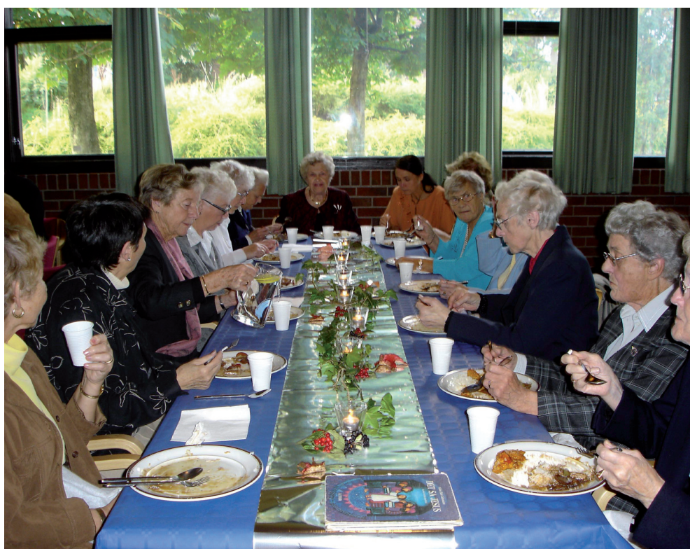
Det ble servert festmiddag som smakte godt (foto: Ragnar Fiskå).