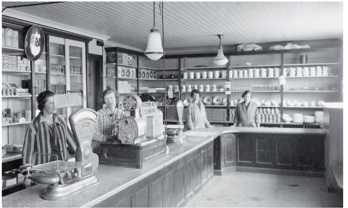
Butikkinteriør Forbruksforeninge Økonom, avdeling 2. i Nymansveien.

Produksjonsforeningen Samhold ble opprettet i 1911. Etter hvert ble det etablert smørfab-