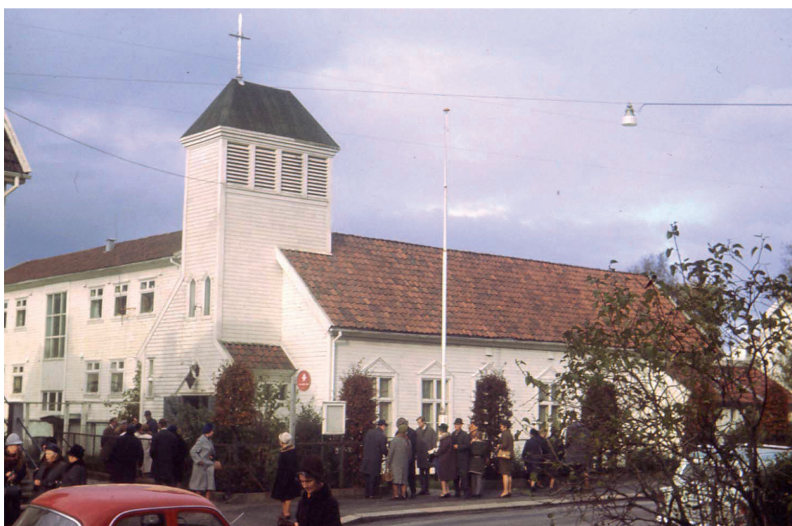
Kapellet i Nymansveien var menighetens første kirke og ble brukt til 1968 da den nye kirken sto ferdig.