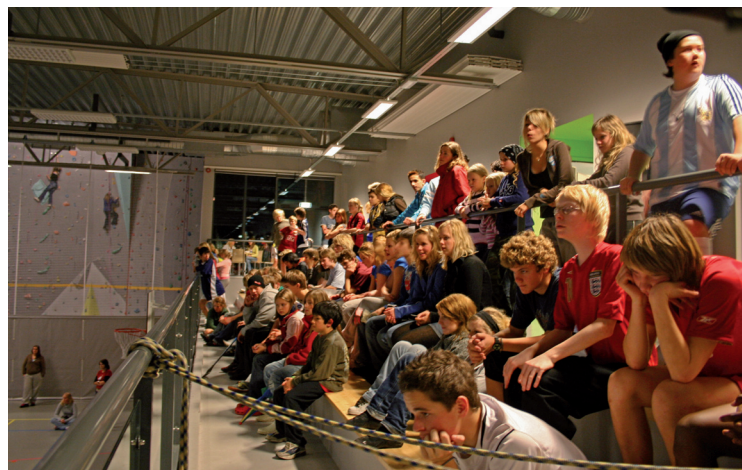
Nightrumble i Storhaughallen