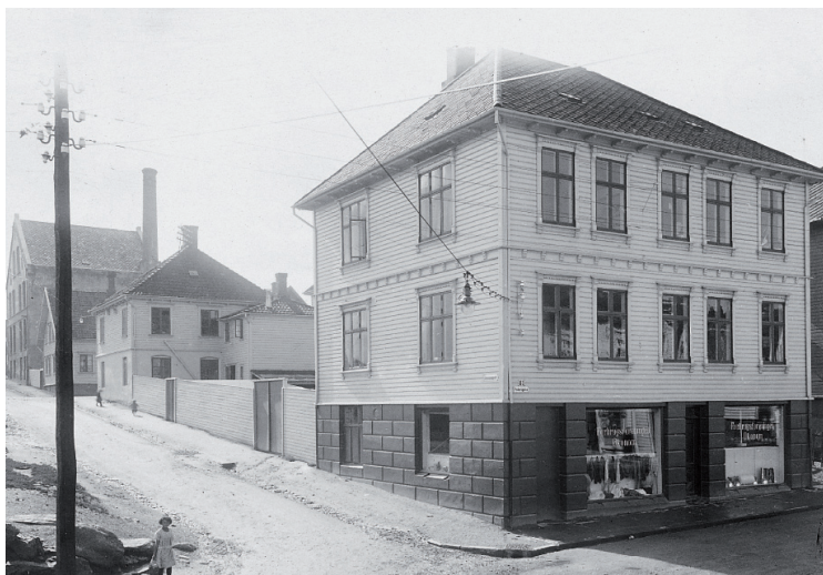
Forbruksforeningen Økonom startet i leide lokaler innerst i Pedersgata i Stavanger. Men etter to år kunne foreningen flytte butikken til eget nybygg i Pedersgata 81. Økonom avdeling 1 holdt til her fra 1902 og helt fram til 1981, altså i 79 år.