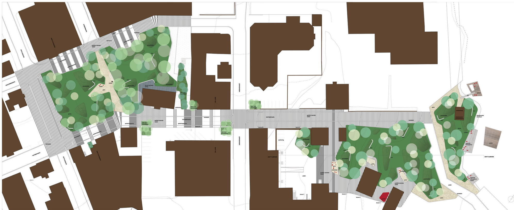
Bypark, Akse og Sjøpark. Illustrasjon fra Schönherr Landskab.

Kulturaksen består fra venstre av de tre områdene byparken, aksens og sjøparken. Området er utformet som en grønn park og blir frodig med klynger av trær. Kulturaksen gir rom for multifunksjonelt bruk pga sitt enkle, men varierende landskap og få ulike elementer. Kulturaksen er et åpent område for alle og kan gi varierte aktiviteter. Parkene er også et godt pauserom for de som jobber eller daglig