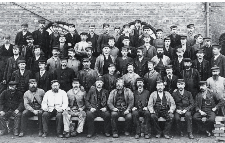
Arbeiderne ved Stavanger Støberi & Dok var særlig aktive med samvirkeorganisering i 1870 – 80 årene. De organiserte såkalte "poseforeninger", felles innkjøpslag for brennevin og dagligvarer. Støberi-arbeiderne startet også to samvirkelag med egne butikkutsalg. Før jul i 1899 tok arbeidere ved Stavanger Støberi & Dok initiativet til Forbruksforeningen Økonom. Denne ble stiftet i januar 1900, og Økonom er i dag det eldste samvirkelaget i Rogaland.