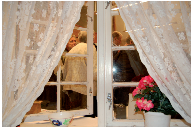
Utstillingen kan også ses gjennom et gammelt vindu.