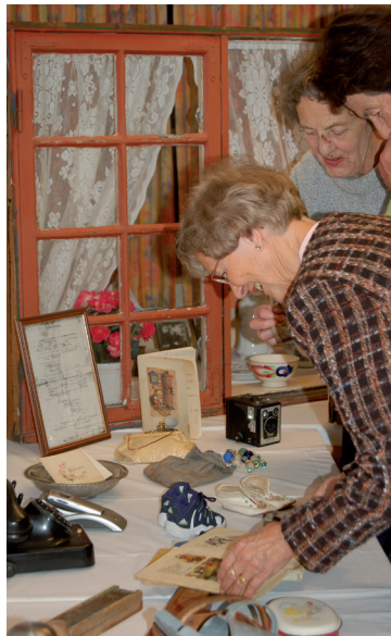
Gjenkjennelsen og gleden over å se kjente, kjære ting er stor!