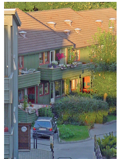
Åkragaten anno 2006.

Kommunen vil arrangere et informasjonsmøte for berørte beboere på Midjord bydelshus i løpet av januar. Boliger som fraflyttes tas ut av bruk. Alle beboere inviteres til egne møter