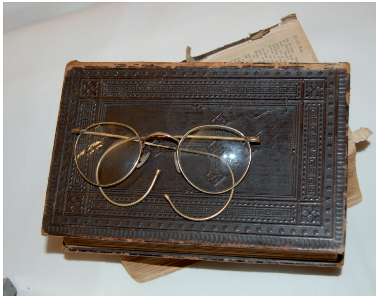
Bibel og briller.