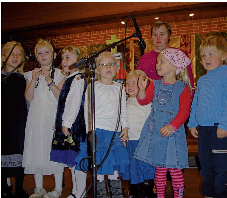
Varden Barnekor sang for full hals.