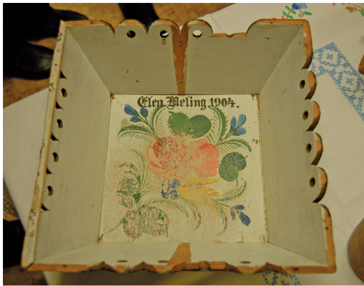
Noen som kjenner igjen denne?

Bilder fra jernbanestasjonen i Stavanger fredsdagene i 1945. En far kommer hjem fra fangeopphold på Grini!