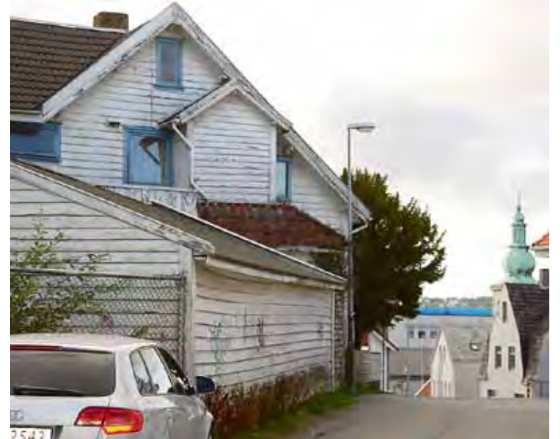
Kongsteinsgata 22 er oppført i 1859 i et område som er prioritert for en fremtidig verneplan.