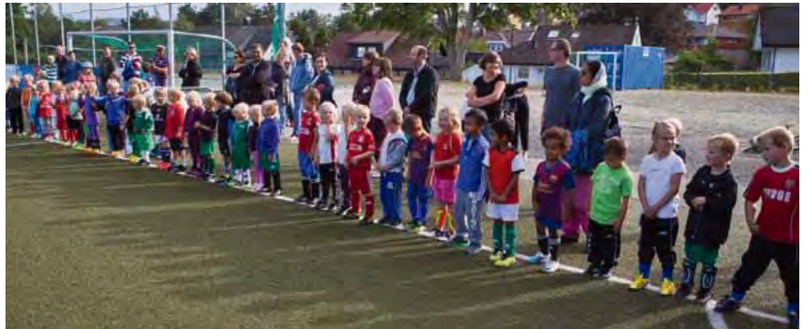
Fra oppstart i Brodd fotball høsten 2013.

Alle treninger skjer på Midjord. Kontakt fotball@brodd-il.no for mer info. http://ilbrodd.no/