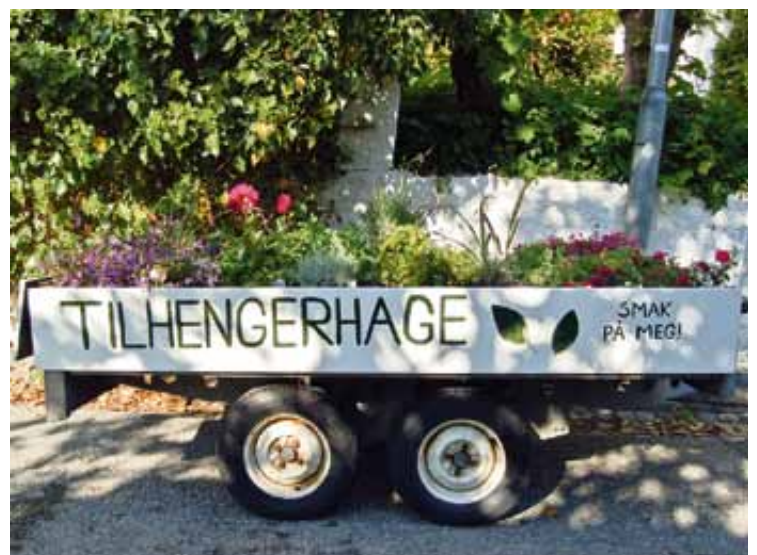
En tilhenger full av vakre blomster og deilige urter. En flyttbar hage som kan dukke opp hvor som helst i bydelen. Les mer om Den spiselige bydel side 8.