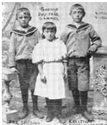
Gunhild med søsken

Sønnen fikk selv tre sønner. En sønn dro tilbake til slekten i Bergen og Askvoll. Vi har fun-