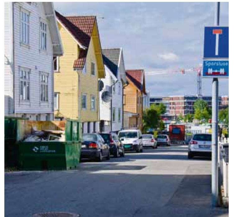
Skal Hasivs gate bli trivelig med benker og planter?

Arrangør: Uteromsprosjekt/ Storhaug bydelsutvalg