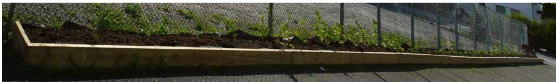
I det lange bedet er det plantet sukkererter, jordskokk, blomkarse og hyllebærbusker. Mange av plantene eies av barn i nærområdet.

i de prosjektene som allerede er igangsatt. Det er selvfølgelig også lov å ta kontakt bare av ren nysgjerrighet for å få vite mer om prosjektet. Ellers oppfordrer jeg folk til å følge prosjektet på facebook siden vår: The-edible-Stavanger-east