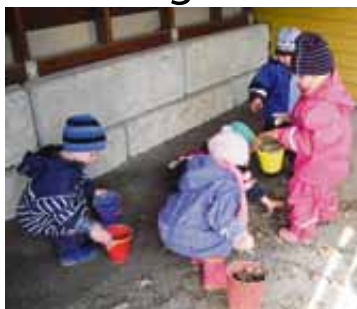
Barna i Steinhagen Barnehage rydder blader under ryddeaksjonen.